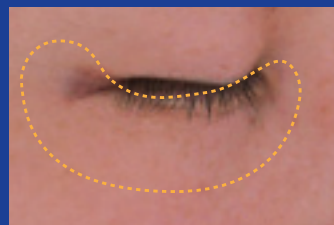
シワの目立ちにくい肌